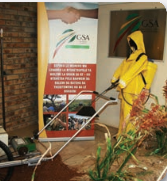
Die Ontwikkelingsprogram uitstalling by Nampo 2011.

Die Ontwikkelingsprogram van Graan SA sal ook 'n uitstalling gedurende NAMPO hê – doen asseblief moeite om ons te kom besoek daar – ons sien uit na jou besoek.